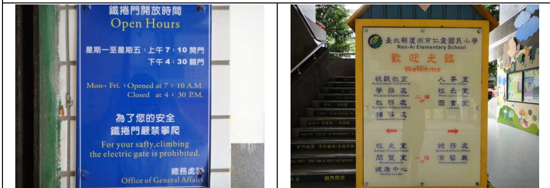
以雙語提醒校園開放的時間