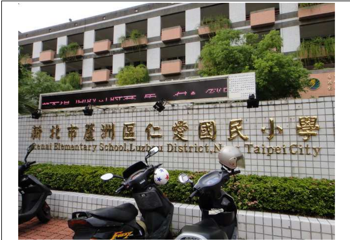
校門口以中英雙語標示